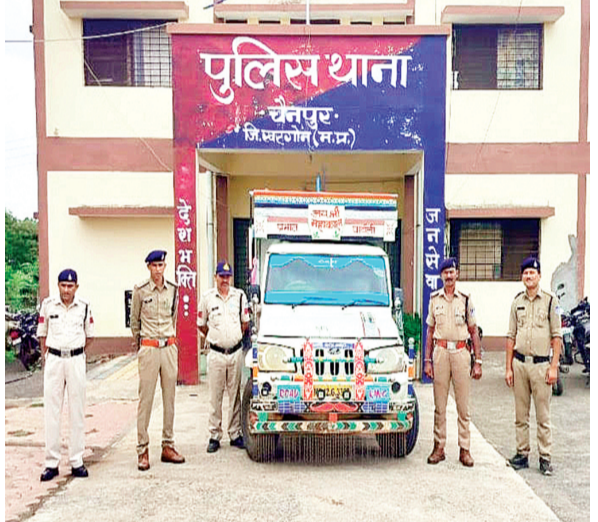
हरिभूमि न्यूज झिरन्या जिसका पीछा किया तो पुलिस टीम को पीछे आता देख चालक चैनपुर पुलिस ने बुधवार को झिरन्या-दामखेड़ा मार्ग पर गोवंश के अवैध परिवहन के विरुद्ध कार्रवाई की है। जिसमें 10 गोवंश (रु.1 लाख) और पिकअप वाहन (रु.7 लाख) को पुलिस ने बरामद किया है। जबकि चालक मौके पर वाहन छोड़कर फरार हो गया, जिसकी तलाश की जा रही है। घटनानुसार मुखबिर की सूचना पर पुलिस ने झिरन्या-दामखेड़ा मार्ग उक्त कार्रवाई की है एक पिकअप वाहन को गोवंश सहित बरामद किया है। पुलिस टीम ने डेहरिया के समीप रोकने का प्रयास किया, परंतु चालक ने पिकअप न रोककर तेज गति से आगे ले गया।