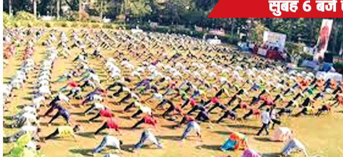
सुबह 6 बजे से होगा आयोजन